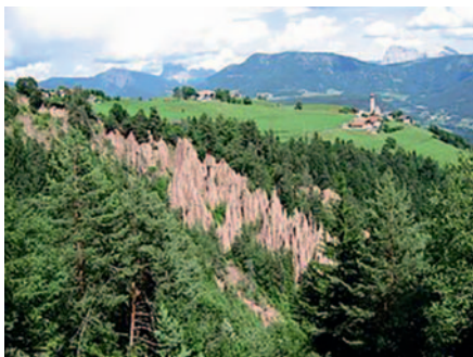
Erdpyramiden am Ritten bei Bozen in den Alpen

Erdpyramiden - (geol.) Sammelbegriff für pfeiler- bis pyramidenartige, meist mit einem größeren Gesteinsstück bedecktes Gebilde, die an steilen Hängen durch fließende Gewässer aus Lockersedimenten (z.B. Moränenmaterial, vulkanischen Tuffen) herauspräpariert werden. Die Entstehung von Erdpyramiden wird durch eine gemischte Korngrößenverteilung im Ausgangsmaterial begünstigt. So führt ein hoher Tongehalt einerseits zu einer großen Standfestigkeit der Formen in trockenem Zustand, andererseits bewirkt er bei Durchfeuchtung eine rasche Lösung des Materials, wodurch in Verbindung mit starken Niederschlägen Gleit- und Fließprozesse auftreten. Die größeren Bestandteile des Sediments werden bei der Abtragung selektiv freigelegt und können als Decksteine an der Spitze einer Sedimentsäule zurückbleiben, so dass diese eine Zeit lang vor weiterer Durchfeuchtung und Erosion bewahrt wird. Der Verlust des Decksteins zieht eine Zerstörung der Form nach sich. Übrig bleiben dann meist Gebilde, die als Erdnadel oder Erdkegel bezeichnet werden.