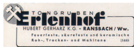
Anzeige von 1952

dauer im Sommer 2,00 Mark pro Tag. Im Winter wurde ein Teil der Belegschaft entlassen, der sich nunmehr durch Holzmachen bei einem Tagelohn von 80 Pfennig bis 1 Mark zufriedengeben musste. Der verbliebene Teil der Belegschaft erhielt als Winterlohn pro Tag 1,80 Mark (Quelle: »Aus der Geschichte Ransbach« von Wilhelm Franz Fohr aus dem Jahr 1943). Nachdem der Abbau unrentabel und eingestellt (1968) wurde, füllte sich die Tongrube mit Oberflächen- und Grundwasser.