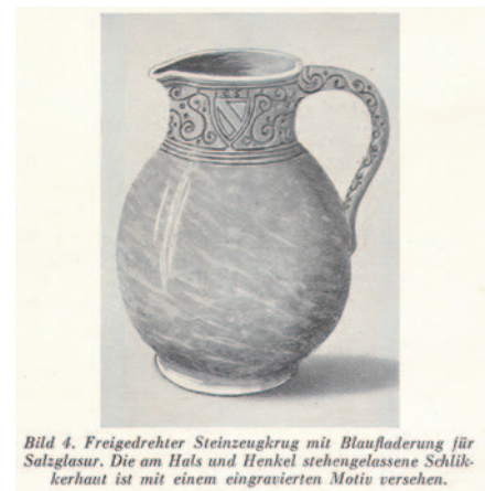
Bild 4. Freigedrehter Steinzeugkrug mit Blafladerung für Salzglasur. Die am Hals und Henkel stehengelassene Schlickerhaut ist mit einem eingravierten Motiv versehen.

First - 1. Bezeichnet die Schicht, die im unmittelbaren Kontakt zum Bezugshorizont, i.d.R. der überlagernden Schicht, steht. 2. Die obere Schnittkante zweier Dachflächen.